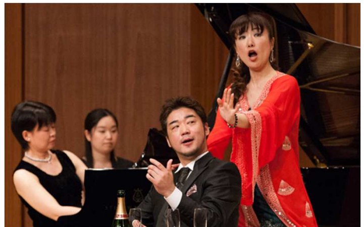
過去開催イメージ